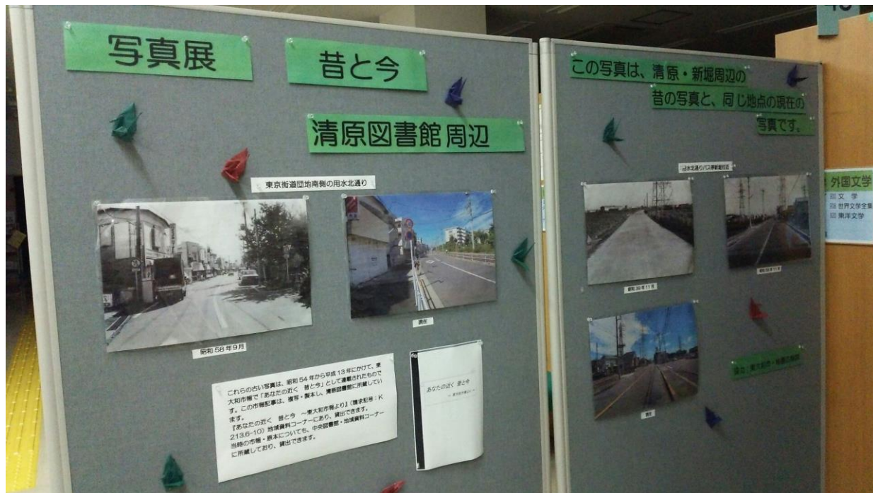
清原図書館は、平成19(2007)年1月19日に誕生しました。

ホームページアドレス http://www.lib.higashiyamato.tokyo.jp