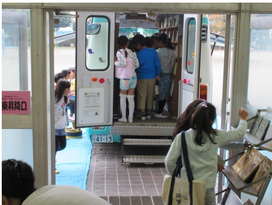
第九小学校 読書の集い

ホームページアドレス http://www.lib.higashiyamato.tokyo.jp